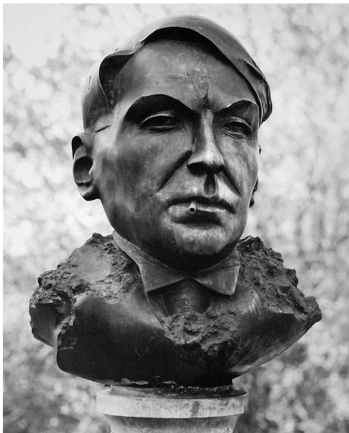
Móra Ferenc-mellszobor (1991)